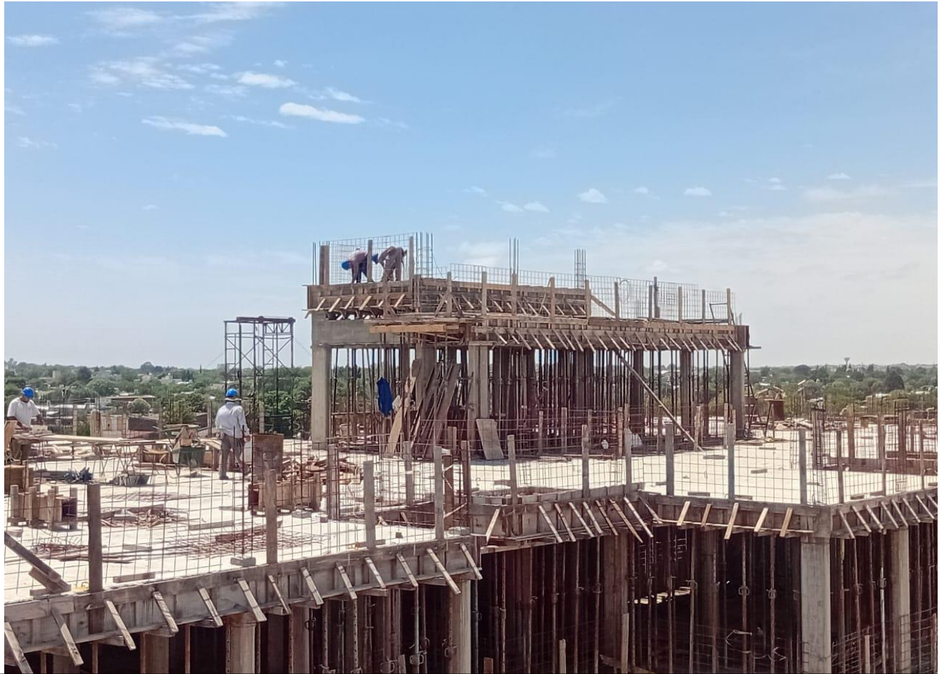
Construcción Estructura sector Terraza