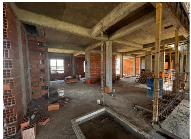
Mampostería en Tercer Piso.